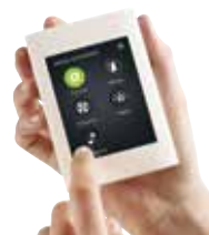
Enervent eAir + webbgränssnitt

Enervent Svea är försedd med anslutning för spiskåpa som även går genom batterimodulen. Frånluften från spiskåpan leds förbi värmeväxlaren i ventilationsaggregatet och luften strömmar direkt till aggregatets frånluftsfläkt. Detta förhindrar att värmeväxlaren blir smutsig och fet.